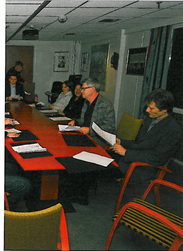
IKKE ULOVLIG: De lukkede fellesborgerlige gruppemøtene i Stjørdal er ikke i strid med loven, slår sivilombudsmannen fast. (Arkivfoto)

– Stjørdal kommune praktiserer en veldig stor grad av åpenhet. Det skal vi fortsette med og ha høy fokus på, sier