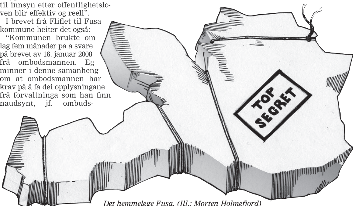
Det hemmelege Fusa. (Ill.: Morten Holmeffjord)